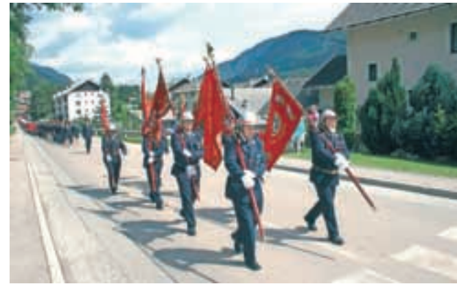
Gasilska parada hrušenskih gasilcev ter njihovih prijateljev iz Gorenjske in zamejstva