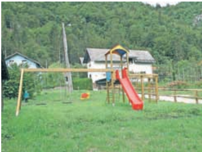
Novo otroško igrišče na Kočni ...

je postavljeno eno večnamensko igralo, vzmetna gugala ter klopi. Vrednost projekta je skoraj 33 tisoč evrov, od tega je petdeset odstotkov neto vrednosti sofinancirano s strani Ministrstva za kmetijstvo in okolje, ki upravlja ukrep LEADER. Izvajalec projekta je bilo podjetje Gonzaga - pro iz Nove Gorice, izbrano preko izvedenega javnega naročila," so povedali na Občini Jesenice. Igrišči bodo slovesno predali name- nu 30. avgusta, ko bo tudi vsakoletna proslava ob krajevem prazniku Krajevne skupnosti Blejska Dobrava.