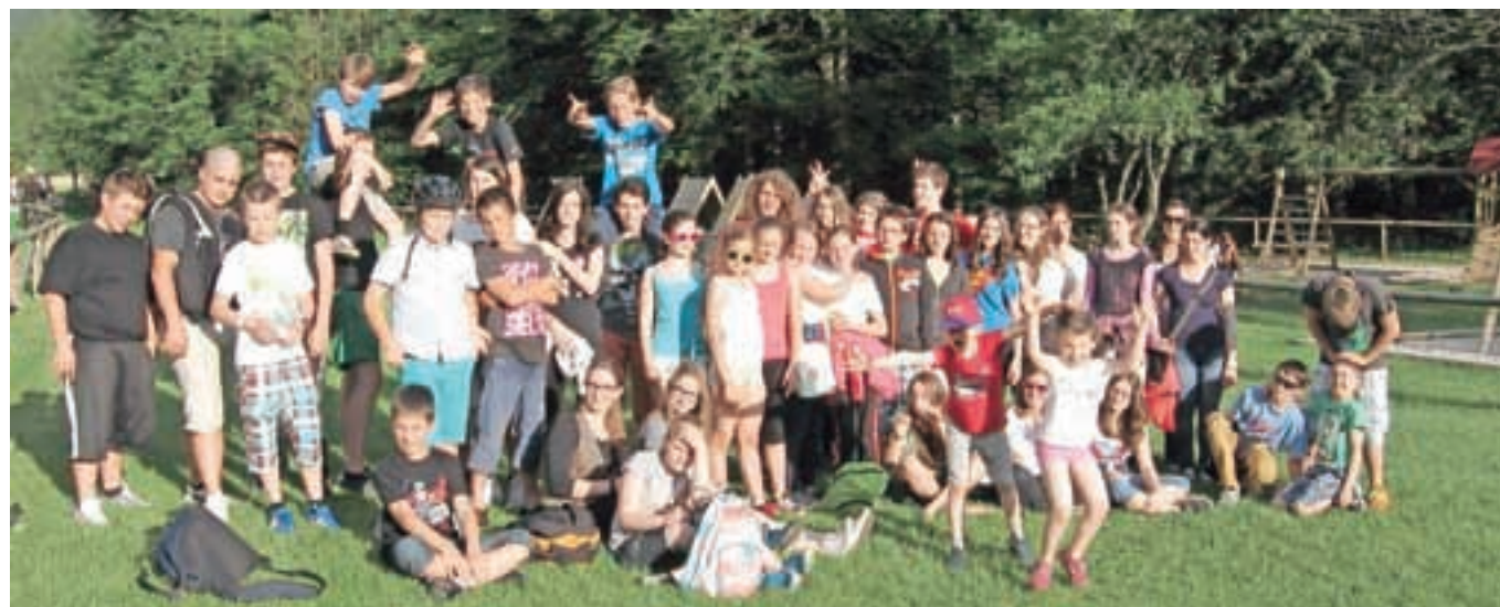
Letošnji osnovnošolski podjetniški forum je potekal v naravi, v dolini Završnice.