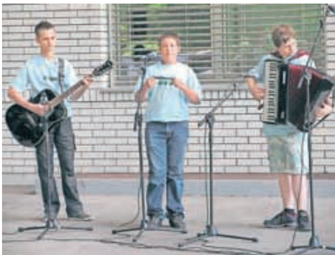
Na slovesnosti vsako leto nastopijo tudi mladi, letos je bil to Trio Kopriva z OŠ Koroška Bela.