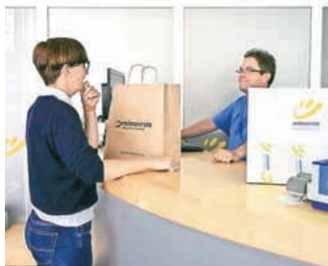
Na Jesenicah je poleg pisarn in klicnega centra tudi prevzemno mesto. / FOTO: PRIMOŽ PIČULIN