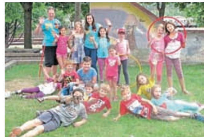
Počitniški utrinek z mladinske točke v Centru II

placu". Za drzne bo postavljena plezalna stena, za željne druženja in zabave bodo na voljo spretnostne gibalne igre, družabne in miselne igre, postavljena pa bo tudi info točka za mlade nad 15 let o poletnih taborih in podpori MCJ njihovim idejam in mladinskim projektom. Zabavno je tudi na bazenu Ukova, kjer vsak ponedeljek od 14. ure do 15.30 potekajo športne igre v vodi in ob bazenu, ob torkih med 14. in 16. uro je na vrsti Time out za MCJ, od 18. do 19. ure pa rekreativno igranje vaterpola. Na bazenu je mogoče praznovati tudi rojstni dan. V športnem parku Podmežakla pa ob sredah potekajo turnirji v nogometu, in sicer od 10. do 12. ure (16. in 30. julija), 23. julija pa pripravljajo igranje košarke in odbojke za mlade (od 10. do 12. ure). Prav tako vabijo k prijavi na avgustovske aktivnosti, in sicer na ogled kmetije Smolej v Planini Pod Golico, na ogled dela policistov vodnikov in njihovih psov na Platoju Karavanke in na pohod na Pristavo z veslanjem na jezeru pri domu Trilobit. Več informacij ponujajo na spletni strani MCJ in Zavoda za šport Jesenice.