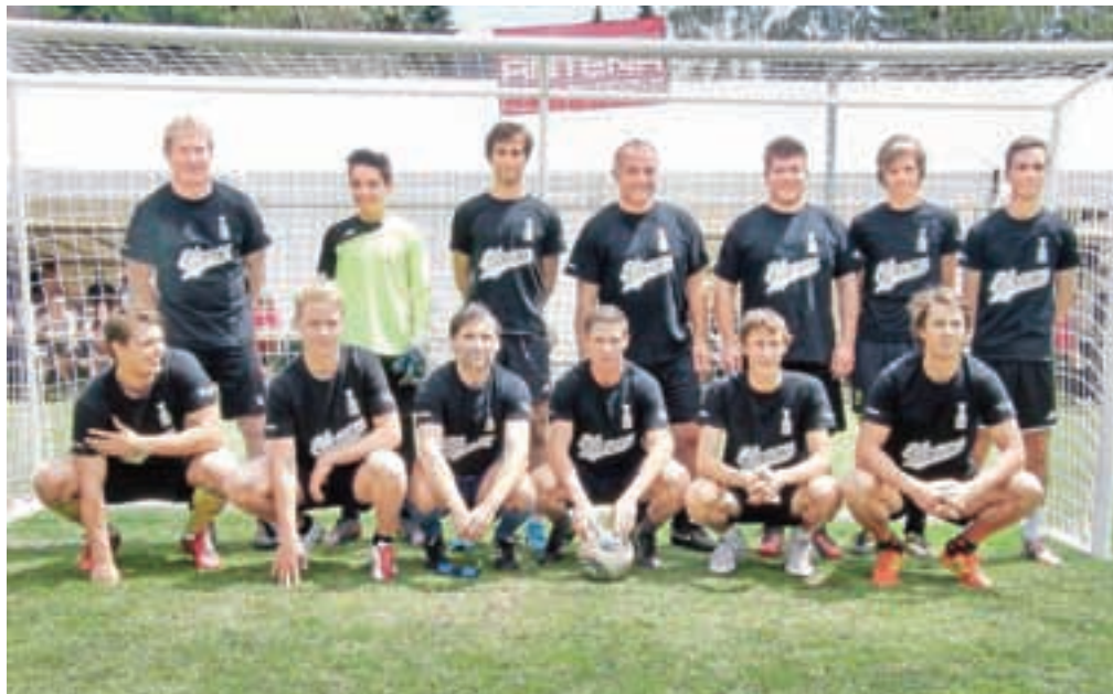
Ekipa Anže's Eleven je tokrat nastopila brez Anžeta Kopitarja.