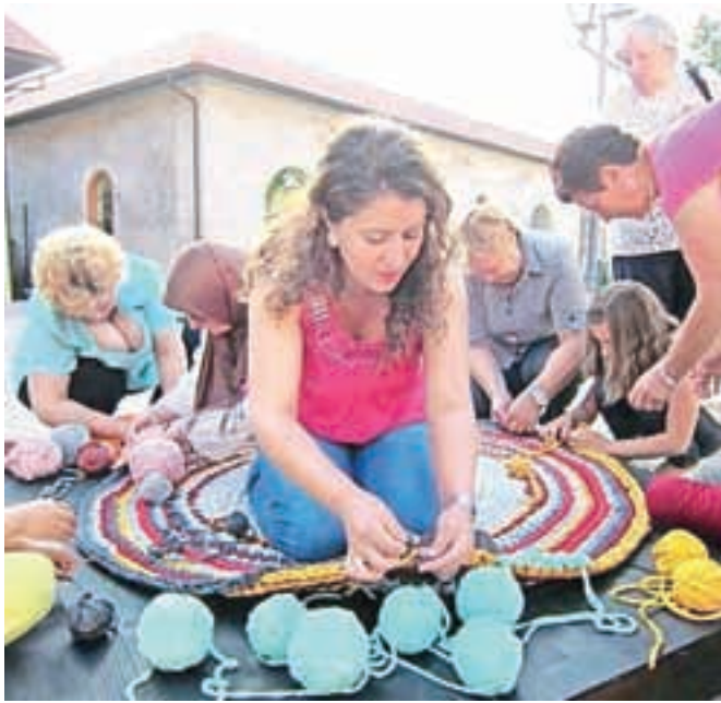
Pletenje skupnostne preproge