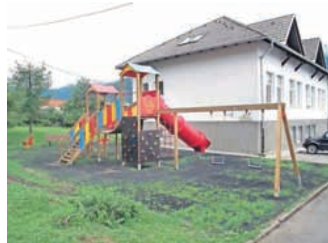
... in obnovljeno na Blejski Dobravi

Na podlagi Javnega razpisa za podelitev koncesije za opravljanje gospodarske javne službe upravljanja in vzdrževanja Tržnice Jesenice