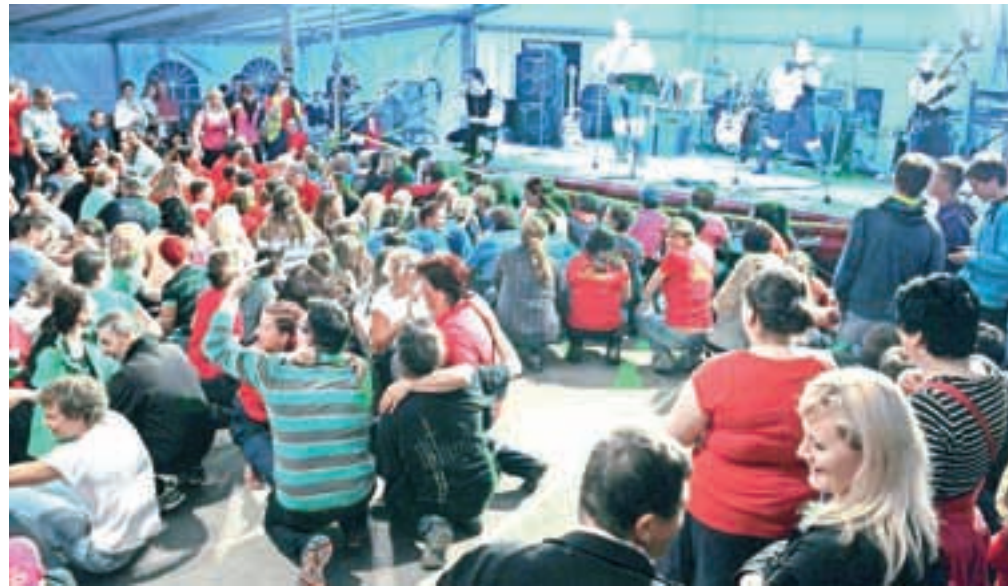
Koncert Modrijanov in poln prireditveni šotor »na placu«

nagovorili tudi predstavniki gasilske zveze Slovenije, Gasilske zveze Jesenice in Občine Jesenice.