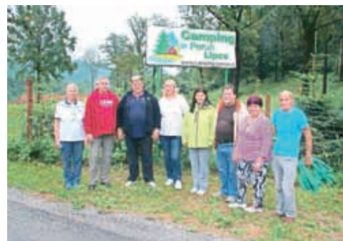
Z uradnega odprtja avtokampa Perun