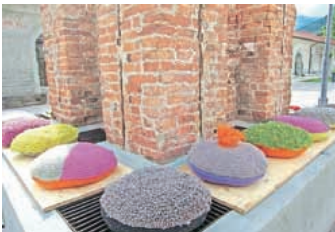
Nenavadna razstava ob plavžarskem dimniku na trgu na Stari Savi

projekcija fotografij od začetkov projekta Razkrite roke, mize so se šibile pod bosanskimi, kosovskimi in srbskimi dobrotami. Dogodek so pripravila dekleta iz zavoda Oloop, društva UP in Gornjesavskega muzeja Jesenice.